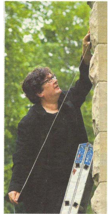
Mark Wallinger (Bild) spannt über Münsters Innenstadt eine Schnur.